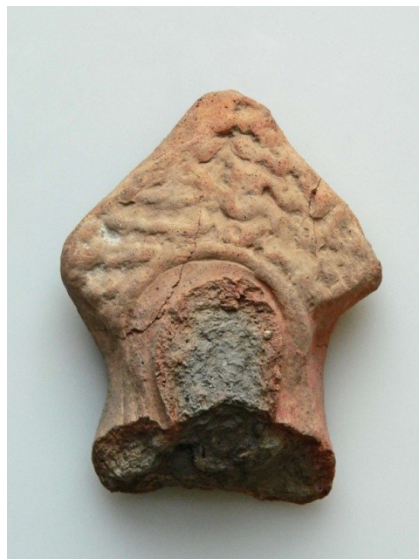
Abb. 6: Fragment eines Votivs, Gießen T III-14 8 .

Beim einem Votivfragment aus derselben Sammlung (Abb. 6) ist das Schamhaar besonders gut sichtbar. Man erkennt den Ansatz der Hoden und die Basis des abgebrochenen Gliedes.