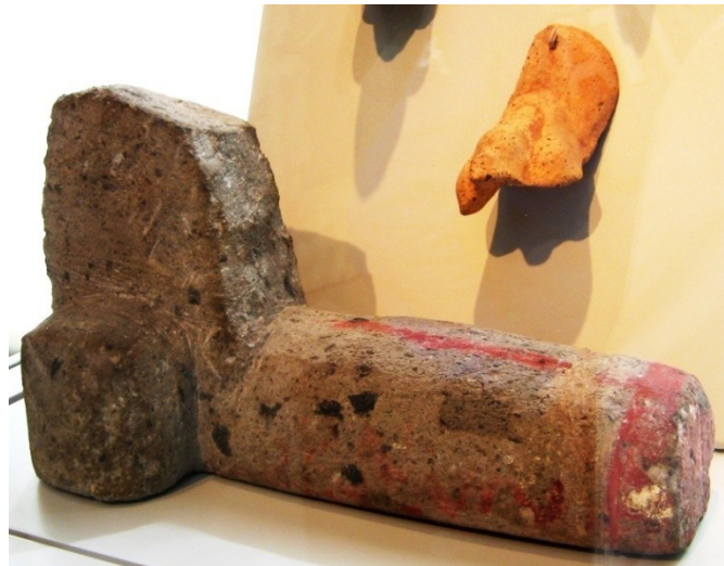
Abb. 1: Italisches, vulkanisches Gestein 3 6./5. Jh. v. Chr. Altes Museum Berlin, Aufnahme der Verfasserin.

Im Altertum gab es außer Händen und Füßen, Augen, Ohren und Herzen auch solche Körperteilvotive, die dem frommen Pilger in Alt-Ötting nicht begegnen 2 . Die Rede ist natürlich von den männlichen und weiblichen Fruchtbarkeitsorganen.