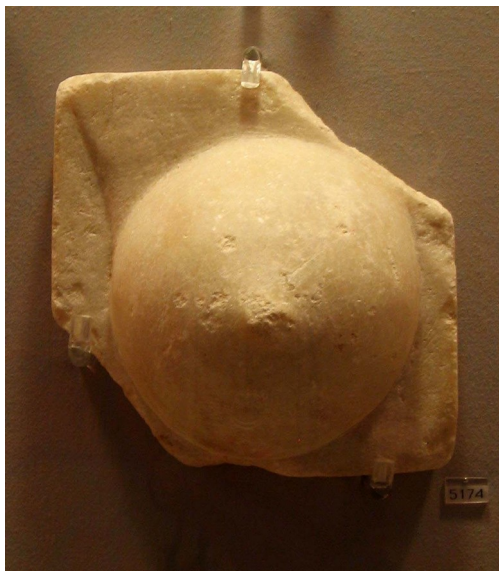
Abb. 10: Marmor. Athen, Nationalmuseum 13 .

Auf dem Fragment (Abb. 10) ist eine halbkugel-förmige Brust mit vorspringender Mamille wiedergegeben.