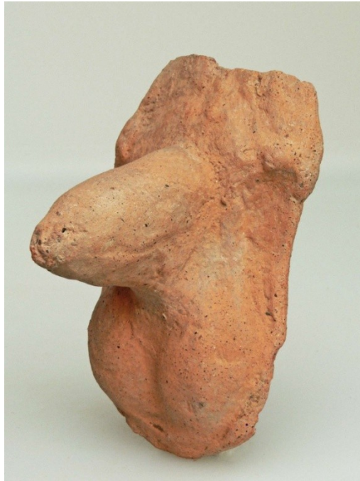
Abb. 5: Terrakottavotiv aus Veji, Gießen T III-15 7 .

Beim einem Votivfragment aus derselben Sammlung (Abb. 6) ist das Schamhaar besonders gut sichtbar. Man erkennt den Ansatz der Hoden und die Basis des abgebrochenen Gliedes.