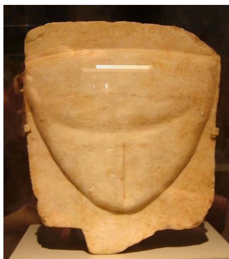
Abb. 9: Marmor. Abdomen mit Angabe der Schamregion. NM Athen.

Aus dem Aphrodite-Heiligtum an der Straße von Athen nach Eleusis stammen Marmortafeln mit dem weiblichen Unterbauch, auf dem eine vertikale Ritzung den Eingang zu den primären Geschlechtsorganen angibt (Abb. 9). Vergleichbare Exemplare bewahrt das Athener Nationalmuseum auf (NM) 12 .