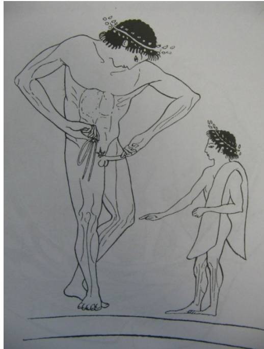
Abb. 3: Detail der Umzeichnung eines Kelchkraters in Berlin. Boardman 1981, 35. 271 Abb. 24,1.

Einen `topographischen´ Überblick vermittelt das anatomische Präparat eines männlichen Geschlechtsorgans (Abb. 4).