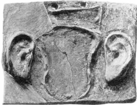
Abb. 7: Korinth, 4. Jh. v. Chr. Nach Roebuck, 1951, 120 Nr. 10 Taf. 33.

Ein Tontäfelchen aus dem Asklepieion von Korinth (Abb. 7) zeigt ein plastisch angegebenes Ohrenpaar, das ein männliches, nur noch als Abdruck erhaltenes Geschlechtsorgan flankiert. Dass es sich um die Darstellung dreier von einer Krankheit befallener Körperteile handelt ist wenig wahrscheinlich. Vermutlich handelt sich um das Weihgeschenk eines Adoranten der sich, besorgt um die Funktionsfähigkeit seines Fortpflanzungsorgans, an einen "gnädig erhörenden" Gott wandte 9 .