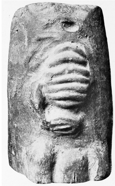
Abb. 8: Uterus, auf die Bauchwand projiziert. Nach Holländer 1912, 193, Abb. 102.

Aus dem Aphrodite-Heiligtum an der Straße von Athen nach Eleusis stammen Marmortafeln mit dem weiblichen Unterbauch, auf dem eine vertikale Ritzung den Eingang zu den primären Geschlechtsorganen angibt (Abb. 9). Vergleichbare Exemplare bewahrt das Athener Nationalmuseum auf (NM) 12 .