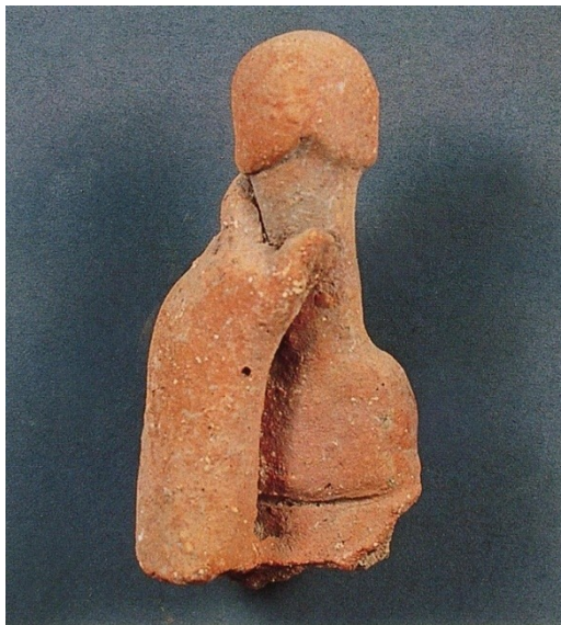
Abb. 2: Kalkstein, Zypern. Nach Florentzos 2003, 47 Abb. 42-44.

Aus einer linken Hand, die einen aufrechtstehenden Penisschaft umfasst, besteht eine zyprische Opfergabe (Abb. 2). Wie nach einer Beschneidung ist die Eichel völlig entblößt. Das Glied hat eine massive Basis und kann nicht Teil einer Statue sein. Die Deutung als Votiv ist plausibel.